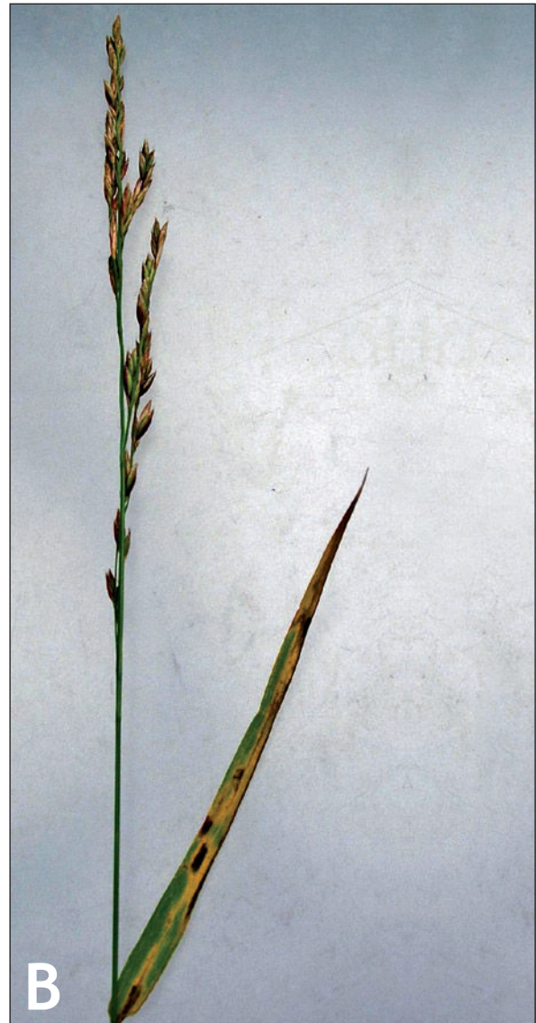
Bilde 1. Brunflekkssopp i timotei (a) og engsvingel (b).